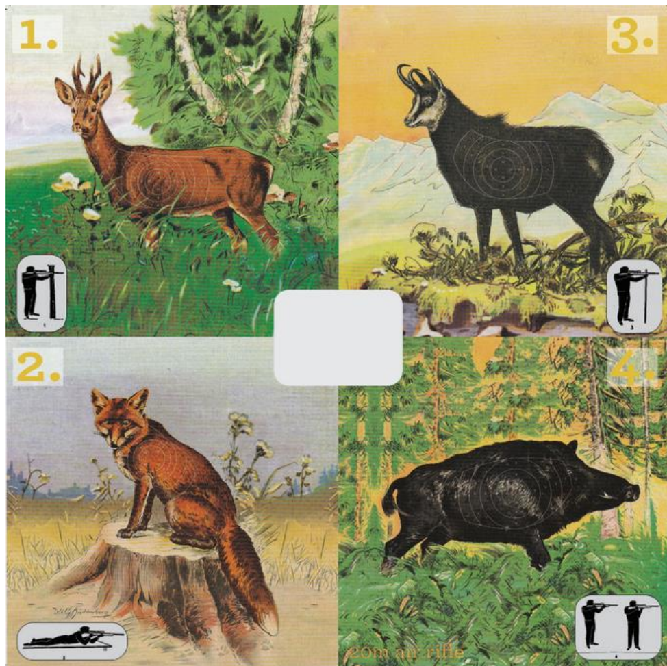
Ilustrācija 2 - mērķi un to šaušanas secība